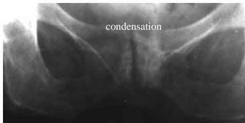
Arthrose du pubis