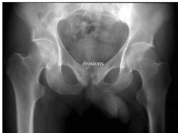
Arthrite du pubis